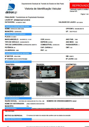
Imagem 15. Do posicionamento da seção no laudo impresso

A conformidade das placas de identificação do veículo vistoriado com a Portaria DETRAN-SP nº 21/2015 deverá ser analisada pela ECV e assentada no laudo de vistoria nos termos do item 8 - Das observações.